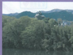
百無瀬橋より望む明智藪と福知山城