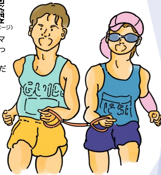
リハビリイラストサイト『えすていちゃん』